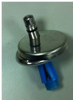
C2802H - со смещенным от центра пином

material: stainless steel 1.4301, PE LD Polyethylen