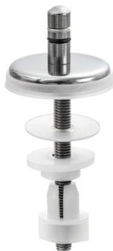
C0202Y – пин в центре