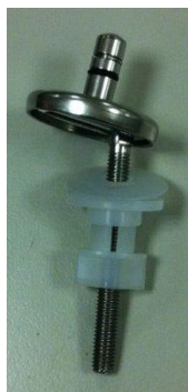
C2702Y – со смещенным от центра пином

material: нержавеющая сталь 1.4301, PE LD Polyethylen, PA Polyamid