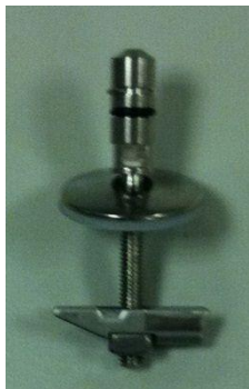
C0102G – пин в центре